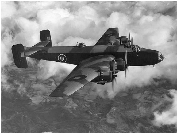
Wapendroppings werden door de RAF uitgevoerd met bommenwerpers, type Handley-Halifax-mk3.