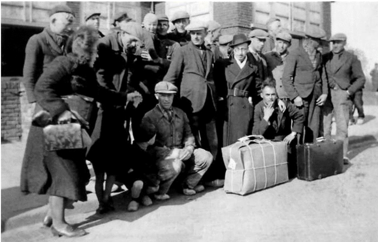
Foto-opschrift vermeldt: "Joodse man wordt opgehaald bij Hotel Smit".

Van deze historische gebeurtenis bestaat een foto.