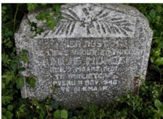
Afbeeldingen grafzerken: Anita Blijdorp