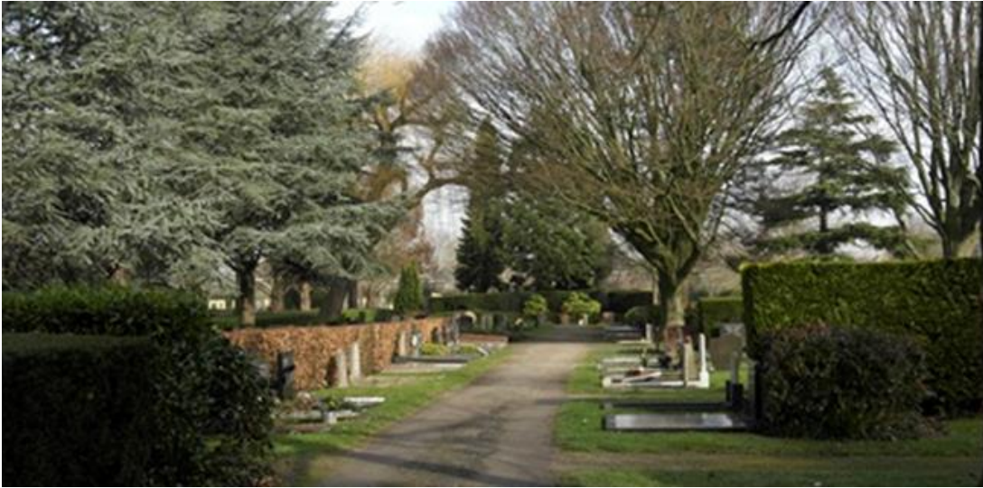
Begraafplaats te Middenmeer, afd. B.