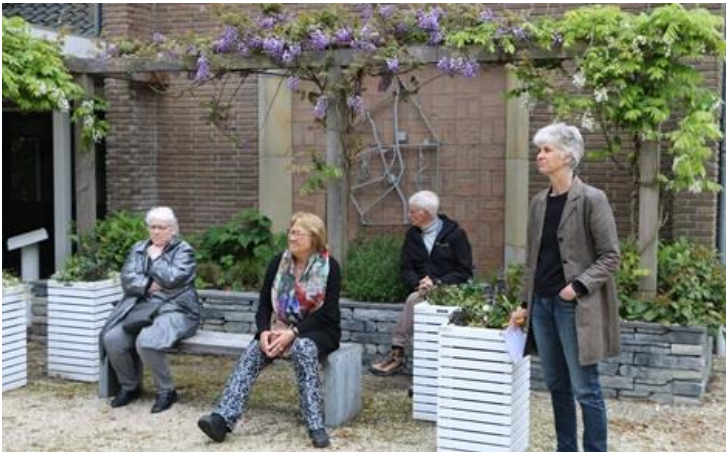
Initiatiefgroep bijeen, voorjaar 2021.

Zo'n 30 personen hebben in de afgelopen twee jaar meegedacht en -gedaan met de initiatiefgroep. Op de volgende pagina leest u wat er zoal is besproken en gedaan.