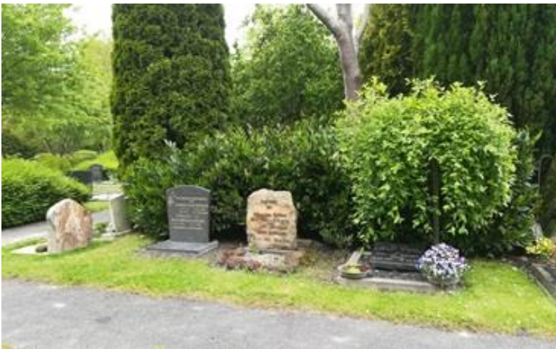
Bijzetting van urnen onder de grond. Gedenktekens op afdeling B.

Deze bijzondere bewoningsgeschiedenis van de Wieringermeer blijft zichtbaar in de grafmonumenten van overledenen.