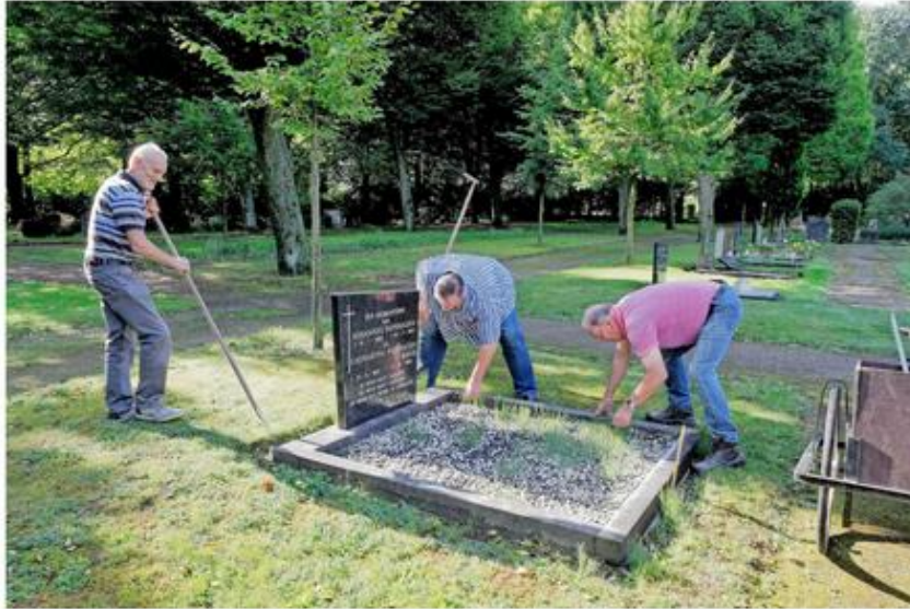
Elke donderdagochtend pleegt een groepje vrijwilligers onderhoud aan de graven waar afstand van is genomen.

De stichting in oprichting wil dat er op een respectvolle manier wordt